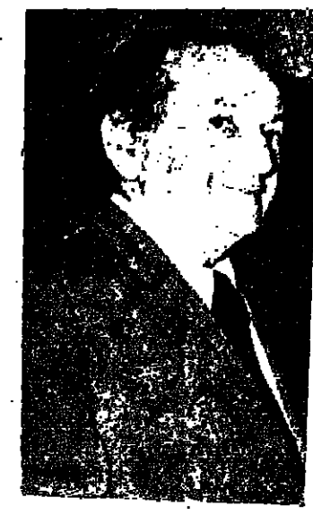
الممثل العالمي سلفستر ستالون ، يمثل فيلم (روكي) الشهير عن الملاكمة ، قام مؤخرا بزيارة باريس لتصوير بعض المشاهد من فيلمه الجديد «هاتوك».

س : أين نحن من المساواة ؟ ج - كثيرا ما يتحدث المستوطنون عن الخدمات والجهود التي بذلت وتبذل من أجل تحقيق المساواة في الخدمات بين المواطنين العرب واليهود .. والسؤال هو : أين نحن من المساواة الآن بعد كل ما بذل من جهود ؟ ج - الحقيقة ان جميع الخدمات التي تقدم للوسط العربي هي نفس الخدمات التي تقدمها للوسط اليهودي ، ولا توجد عندها دائرة خاصة للمواطنين العرب ، وذلك لاننا نلتحقنا من مبدأ المساواة في الخدمات .. الا ان هناك ملاحظة عامة ، وهي ان الوسط العربي هو مجتمع له تقاليد ، والتعاونيين فئات هذا المجتمع في كل قرية عربية كبير ، مما يقلل من حاجة المواطنين العرب للخدمات الاجتماعية .. فعلا اذا كانت هناك مشكلة اجتماعية في كل ايب مثل هروب الاولاد من المدارس وغير ذلك ، فان مثل هذه المشكلة غير موجودة في الوسط العربي ، وان وجدت فحسبها يكون اصغر من حجم المشكلة في الوسط العربي ، وان وجدت في خدمات الاجتماعية تكون اقل اضا .. ومع تطور الخدمات في زيادة الحاجة الى خدمات اجتماعية ، فقد أصبحنا بحاجة الى موظفين مختصين يركزون جهودهم لمعالجة مشاكل المواطنين العرب التي تزيد حجمها